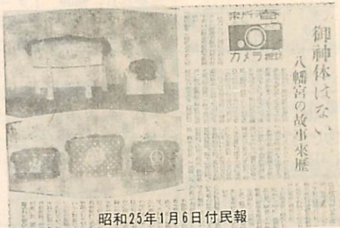
昭和25年1月6日付民報

いま、ご神体は その後の新聞報道によるとご神体は三神とも白銅製の鏡が象徴とか鏡は直径一五・一五センチあり、錦袋に包み、袷製脚つきの唐ひつに納められてあり（二十五年一月に撮った写真を見ると）中央に誉