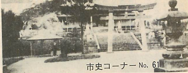
市史コーナー No. 61