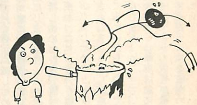
食中毒シーズンです。食品の管理に万全を

絵鞆町B団地12区画、絵鞆町C団地6区画を申込順に分譲しています。 価格など詳しいことは、室蘭振興公社(青少年科学館向い ☎21111内線663～666)におたずね下さい。