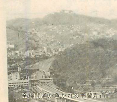
全線開通が急がれる室蘭新道

また、本市発展に欠くことのできない懸案事項の早期実現についてであります。昨年、関係機関並びに市民各層のご協力により開通いたしました室蘭新道自動車専用道路について、残り区間の完成に併せ、最重点課題の白鳥大橋とこれを核とした環状道路網の確立、北海道縦貫自動車道、道々室蘭・札幌間(美笛経由)道路並びにフエリー埠頭の整備を中心とした海上基地づくりなど、港湾機能の強化についても積極的な運動を続けていく所存であります。