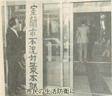
市民の生活防衛に

といたしましたは、さらにその施策の積極的かつ効果的な推進を図るため、私が本部長となりました「不況対策本部」を本日設置し、推進体制の強化を図って参りたいと存じます。