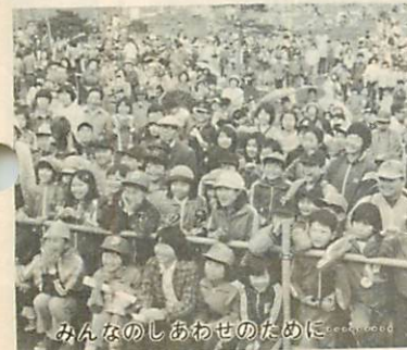
みんなのしあわせのために

さらに、私が市政執行の重点目標としております社会福祉の充実、教育環境の整備拡充並びに道路、公園等、生活環境の整備など各施