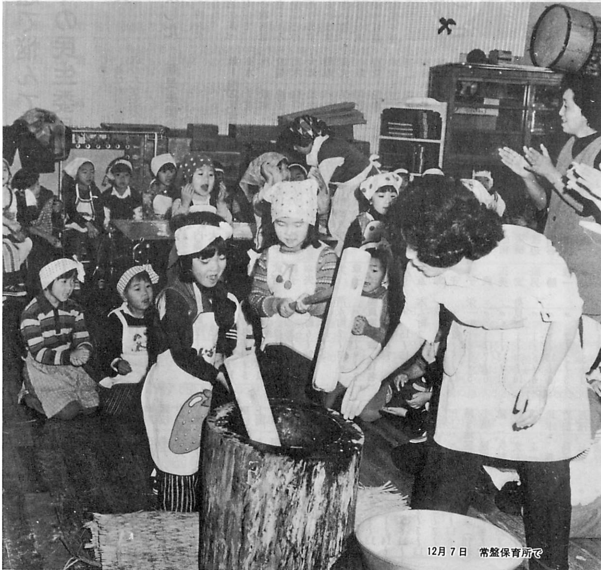
12月7日 常盤保育所で