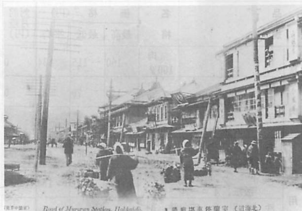
Road of Muroran Station, Hokkaido 通商場車体留室 (道南北)

山越屋の旅館主の藤岡熊太郎（「室蘭の うつりかわり」一九八頁の④は⑤の誤り） は「金久保の親分」と呼ばれるヤクザ。関 西で「会津の小鉄」の子分となって度胸を みがき、二十七、八歳のとき小樽に渡って