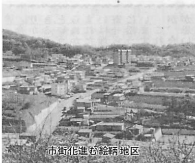
市街化進む絵鞆地区

市では、現在、土地所有者の協力のもとに、明るく住みよいまちづくりをめざし、土地区画整理事業を実施しています。今、絵鞆地区画整理事業施行区域内の保留地と称する「事業費に当てるために、定められている土地」を、次により一般に公売することにいたしました。ご希望の方は現地に保留地の表示板を立ててありますのでよくご覧の上、申込書を提出して下さい。