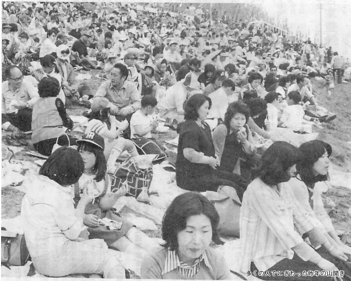
多くの人でにぎわった昨年の山開き