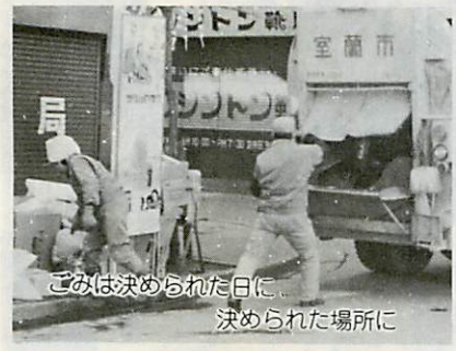
ごみは決められた日に、決められた場所に