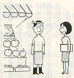
物価調査にご協力を 全国物価統計調査

五月二十日頃から二十七日にか けて、「昭和五十二年全国物価統 計調査」が実施されます。