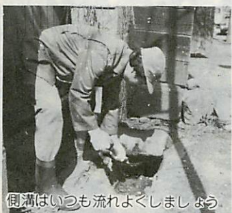
側溝はいつも流れよくしましょう