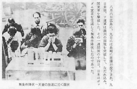
無条件降伏～天皇の放送に聞く国民

日露日の戦も警報命令のなかで明けた。またあすもア ランの砲撃も機銃掃射の轟音を聞きながら寝ながら おののかせなければならぬ。そんなじりじりとした不安 一夜をすごした市民の耳に、五時ごろ警報警報と空 警報機がたてつけに鳴り 響いた。各家庭では驚き ぞわぞわと、家族の一 人が防具をとり、この 大規模防空隊と各家庭の 型持避難に準備した。山が ちの地形を利用して山ぎわ や崖下に岩石を積みぬいて