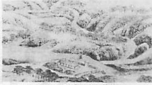
パケレオタの南西海岸に北海道建設局

の首領は、大正十一年一月、一〇二 いたん編成した。翌年一月、一〇二 は七郷の編成を経て神楽川中に停泊、開港に対する 回答を待たず、 かく三月十日、神楽川条約（十一月には日露和議条約に 調印）が結ばれ、下田と箱根の二港が開港場となった。 開港場となった箱根（ペリ）が扱われることになり、低 前浜正戸港と高野港の間に、助定奉行よりの高野が、相模 後して箱根に据わったので、海の高さはひとかたにかはな