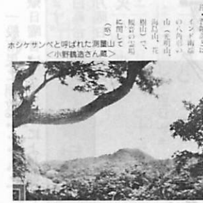
ホシケサンベと呼ばれた集落 ＜小野孫吉さん蔵＞

「ホシケサンベ」は、この辺りにすがる集落よし、別富士に似た山なり、この土に聲音にても安眠せしむ、おおいに御座る人数も、土の辺りを踏みならし、開拓の一助となることあるべき、いかにも昔話世界といへべきなるなり。