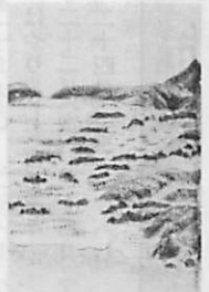
チマイベツの在任<延暦寺検校園>

箱根場所が、箱根、室蘭の二場所となつて、いろいろ大平 は南部藩の領地となつた。箱根直轄の家領場所の管轄は 南部藩がうけつたが、場所責任人は変わらなかつた。 室蘭場所は、全所をチマイベツ（三川町）であり、 地域二狭いが、全所には管轄、全所などがあるほか 砂原、野ノ木（室町）へ渡る家所として旅人宿、商人、 その他で繁華をなす、アイヌも十軒ほどあった。ことに チマイベツが平地が割りと広く、地味もやよよかつた たところから、この地は安永年間（一八四九〜一八六 〇）のころから在任が人柄し、間近にあつた。 在任というには、幕府が前地の開拓あわせて之辺 の管轄を目的に土族を移住させたものであり、原本の一