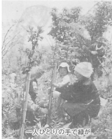
一人ひとりの手で緑が

どなたでも、一生のうちには永く心にとめておきたい。よろこびがいくつあることでしょうか。結婚、誕生、そして入学、卒業、そんな時にあなたも記念植樹をさ