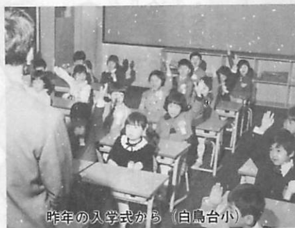
昨年の入学式から (白鳥台小)

学校は楽しい集団生活の場であると同時に「学習」の場でもあります。この「学習」の場ということが先にたち、入学前に、文字や数字をおぼえさせ、簡単な読み書き