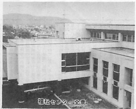
福祉センター全景