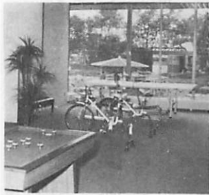
▲機能回復コーナー

利用される方の資格を確認するため、保険証、身障手帳、療育手帳等を印かんと一緒にお持ち下さい。