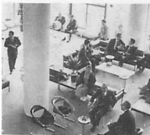
▲ロビーでくつろぐみなさん