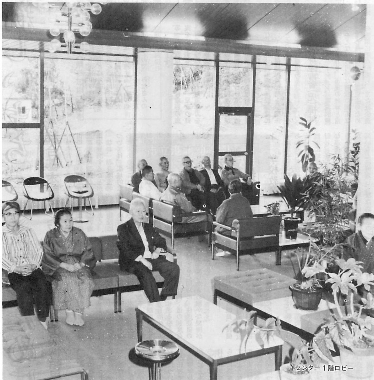
センター1階ロビー