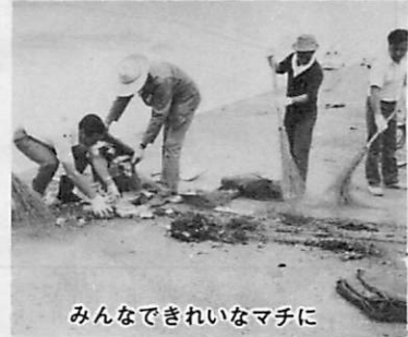
みんなできれいなまちに

室蘭をきれいにする 市民運動実 行委員会では、秋の大 掃除月間（ 九月十五日 ～十月十四 日）を迎え 市とともに 活発な清掃 運動を実施 します。