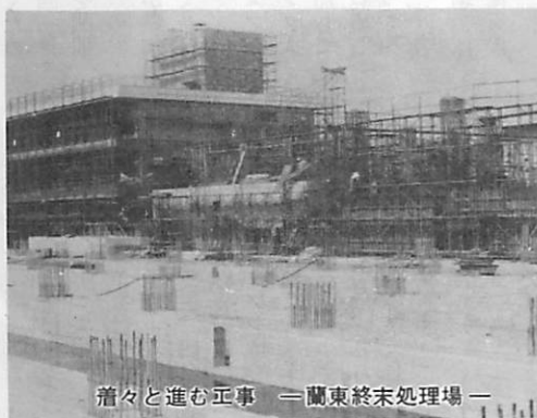
着々と進む工事 一蘭東終末処理場一

「全国下水道促進デー」は、地域住民・地方公共団体・国が一体となり、私たちの生活にとって重要な施設である下水道の整備を計画的に推進し、快適で健康な生活環境と国土を造るための国民運動の日で、毎年九月十日に実施しており、今年で十六回目を数えます。