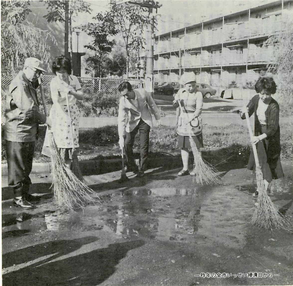
—昨年の全市いっせい掃清日から—