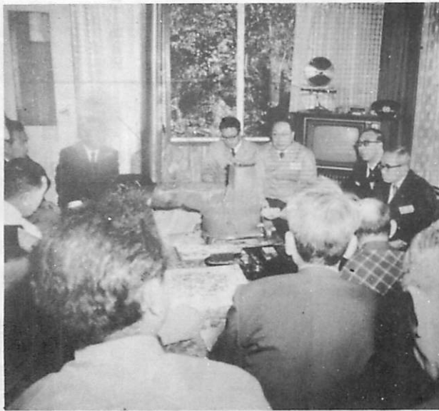
青空対話や懇談会で

な推進を目ざして行きたいと考えています。まずそれには、市民の住民組織である町内会、自治会、諸団体を広く対話を行い、市政全体にわたる提言を呼びかけ、これらの「生の声」を掌握して、あらゆる角度から調査、検討のうえ最大の効果に結びつけるという運動を反復しながら、市民参加、市民総意による市政へと推し進めております。