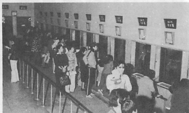
▶ 魚類もより豊富に……

現在、福祉年金を受けている人は、毎年五月に「福祉年金定時届」をすることになっています。 この届出は、福祉年金を受けている人、その配偶者または世話をしている扶養義務者などの前年における所得の状況を届けるものですが、これによって今年の五月から来年四月までの一年間、福祉年金を支給するかどうか決定する重要な届出です。