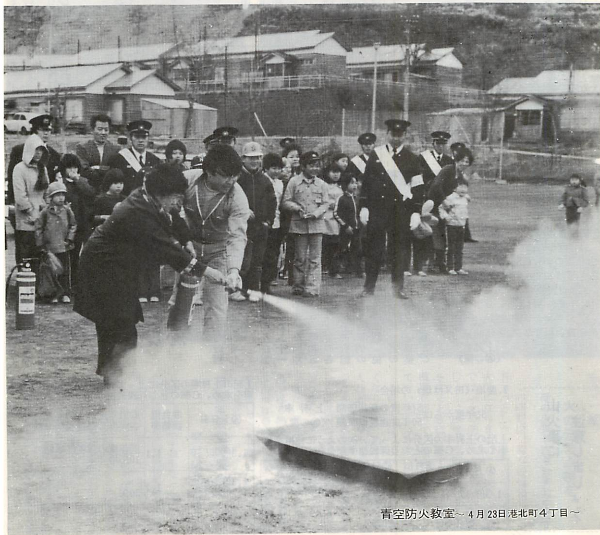
青空防火教室～ 4月23日港北町4丁目～