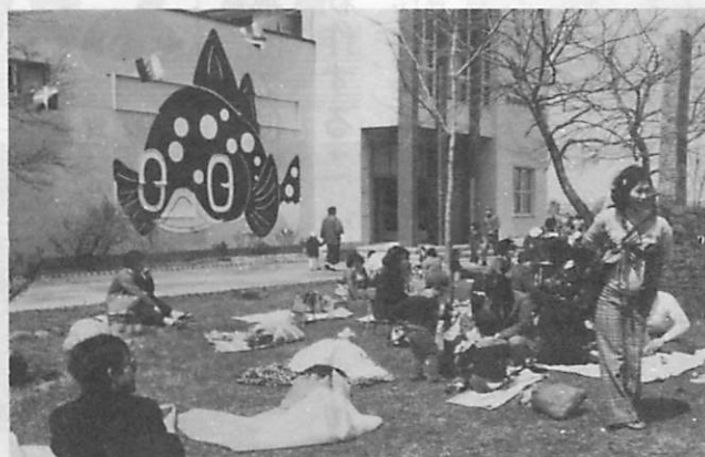
水族館のシンボルマーク アブラボウズ