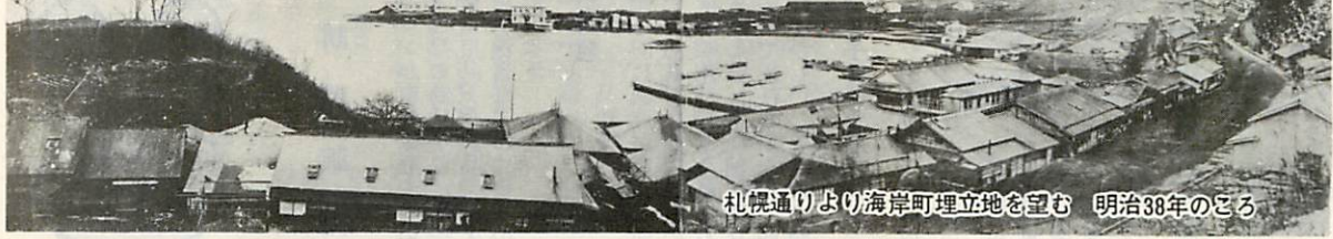
札幌通りより海岸町埋立地を望む 明治38年のころ