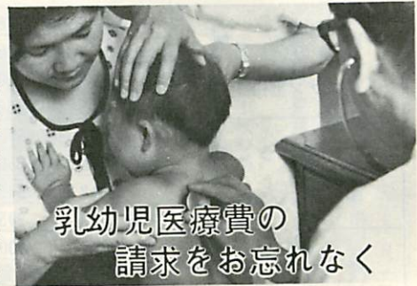
乳幼児医療費の請求をお忘れなく

さあ夏に溜った「ほこり・ごみ」を追放しましょう。市は市民憲章の実践項目のひとつとして、清掃運動をすすめています。9月15日から1カ月間「全市秋の大掃除運動」を次の要領で実施しますので、ご協力ください。