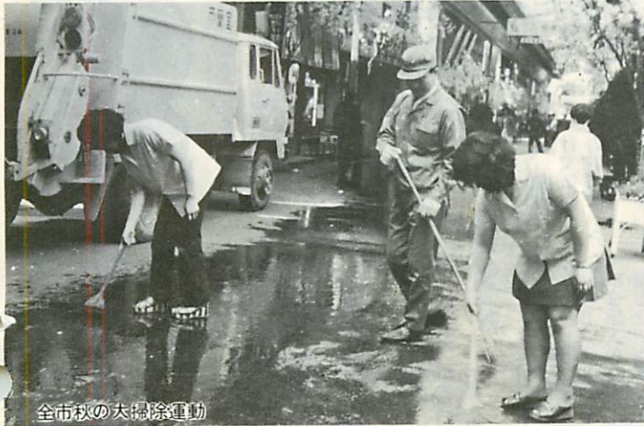
全市秋の大掃除運動

さあ夏に溜った「ほこり・ごみ」を追放しましょう。市は市民憲章の実践項目のひとつとして、清掃運動をすすめています。9月15日から1カ月間「全市秋の大掃除運動」を次の要領で実施しますので、ご協力ください。