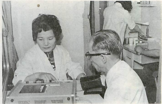
検査車内での血圧測定

みなさん、三十歳半は過ぎたら定期的に、少くとも年一回は検診を受け、成人病予防につとめましょう。 すずんで受けましょう 成人病検診 つぎの要領で、「成人病検診」を実施しますので、三十歳以上の方はすずんで受けて下さい。 ▽対象者 三十歳～六十四歳 ▽検診料 無料 ▽検査項目 第一次 身長・体重・問診・血圧測定・尿検査 第二次 心電図測定・眼底検査 血液検査 ※一度も受けたことのない方は、必ず受診して下さい。ただし、現在治療を受けている方は除きます