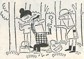
林野火災予防運動