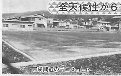
完成間近のテニスコート