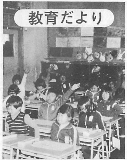
大きな声でハイイと