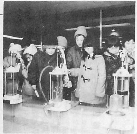
小さな夢が 大きくふくらむ

子どもは、いろいろなことを見聞きし、また、さまざまな体験をつみかさねて、人間としての英知を身につけていくものです。 書少年科学館では、この子どもたちの期待にそえるよう、きょうも、また、新しい特別展の企画や面白い展示品づくりをすすめています。