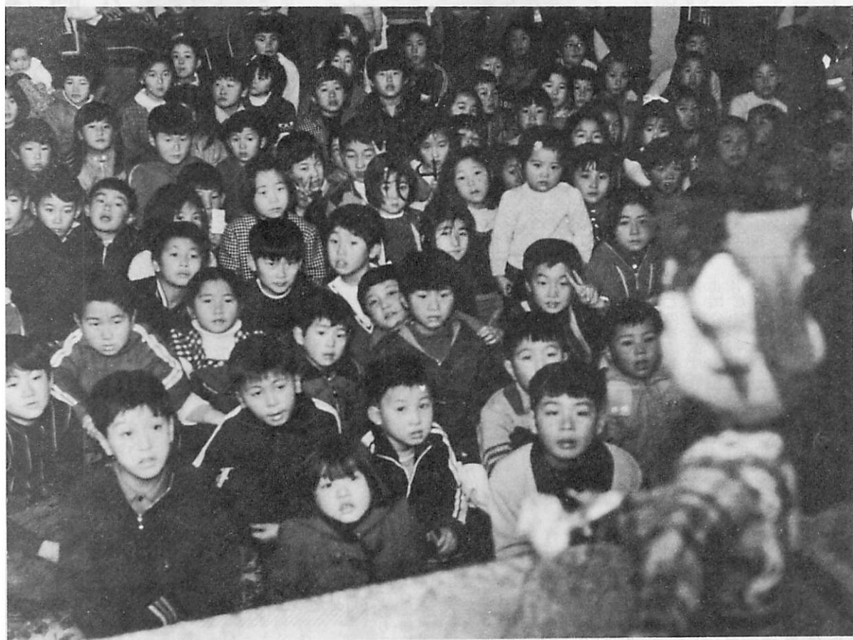
— 新しい児童館で人形劇を楽しむよい子たち —