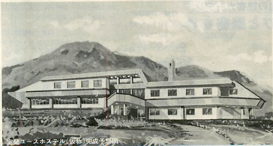
室蘭ユースホステル(仮称)完成予想図

水道故障はどうぞ 水道修理サービス 冬をむかえ、市水道部では、「秋季漏水防止サービス月間」として、つきのとおり修理サービスを行っております。 水道が故障しているご家庭は、早めに申し込みください。 ●期間 11月1日～30日まで ●修理サービス内容 ● 駒かわ、ビス、押ゴム、輪ゴム、パッキン等の取替えは無料 ● 給水栓、給水管の修理は、材料費は実費、労務費は半額をサービスします。 ●申込み先、市水道部工務課 繕係(四一六一七)へどうぞ