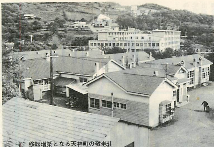
移転増築となる天神町の敬老荘

現在天神町にある敬老荘は、昭和二十八年七月、工費千五百八十四万円で建設されたも 現在天神町にある敬老荘は、木造で老朽もひどくな てきたため、市では、道および国の関係機関に対して、移転増築と定員増を積極的に進めてきたところ、このほど、厚生省との話し合いで国の補助の見通しがつき今月中旬ころから本格的に工事が進められることになりました。 新しい敬老荘は、鉄筋コンクリート平屋建て、約千七百平方メートルで、これまでの敬老荘より約二百平方メートル広く、収容人員も三十人増の百十人で、ひとまわり大きなものになり