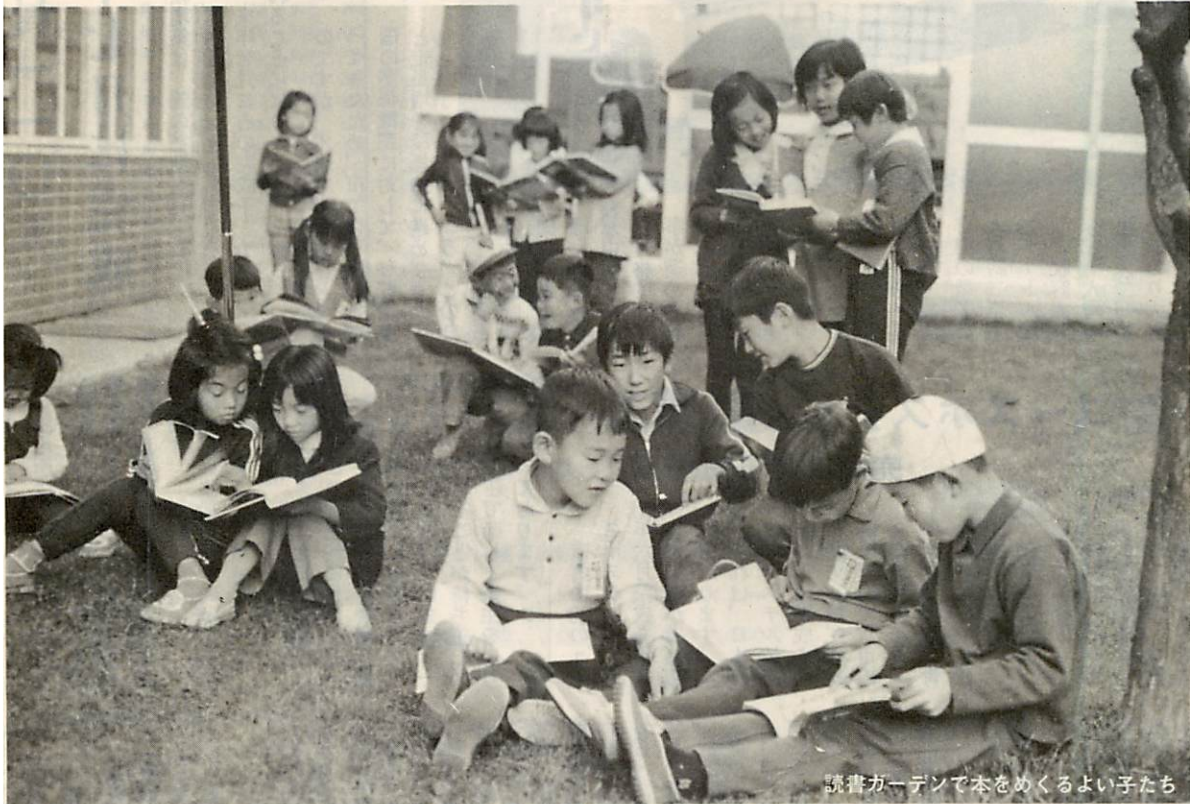
読書ガーデンで本をめくるよい子たち