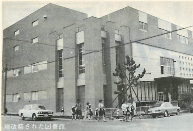
増改築された図書館

今年の2月から、工費4,800万円で行われてきた「市立室蘭図書館」の増改築工事がこのほど完成、10月1日オープンしました。