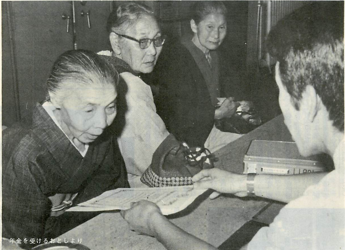
年金を受けるおとしより