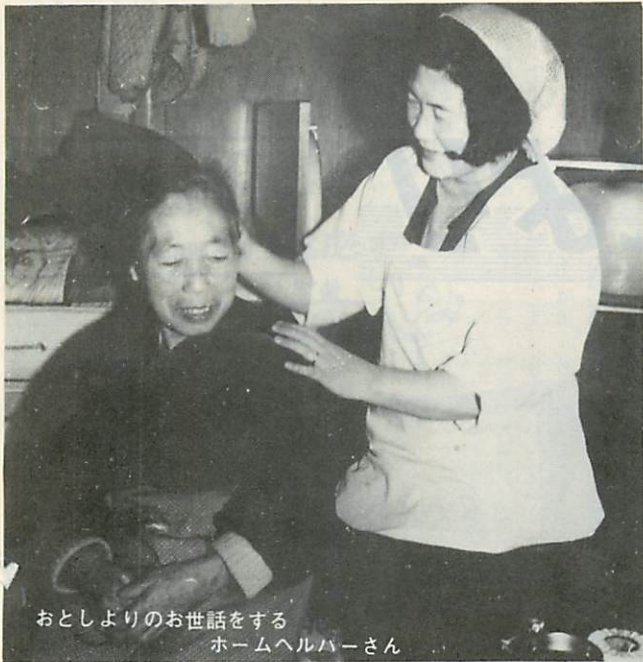
おとしよりのお世話をする ホームヘルパーさん

お子さんが生まれたのをきっかけに、若い息子夫婦から「おじいちゃん」「おばあちゃん」と呼ばわりされるのをいやがる初老のご夫婦を見かけました。 「かわいいお孫さんから「おじいちゃん」「おばあちゃん」と呼ばれるのを嫌うのは、何となく情けなくなるのも当然です。 とかく老人あつかいにされることをきらうおとしよりの多いこのごろです。言葉づかひにもうすこ