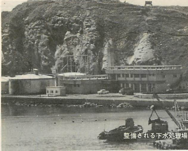
整備される下水処理場

九月十日 全国下水道促進デー 下水道は文化都市のパロメータ ーといわれるほどですが、「下水 道はなぜ必要か」とあらためて 考える人は少ないのではないでし ょうか。