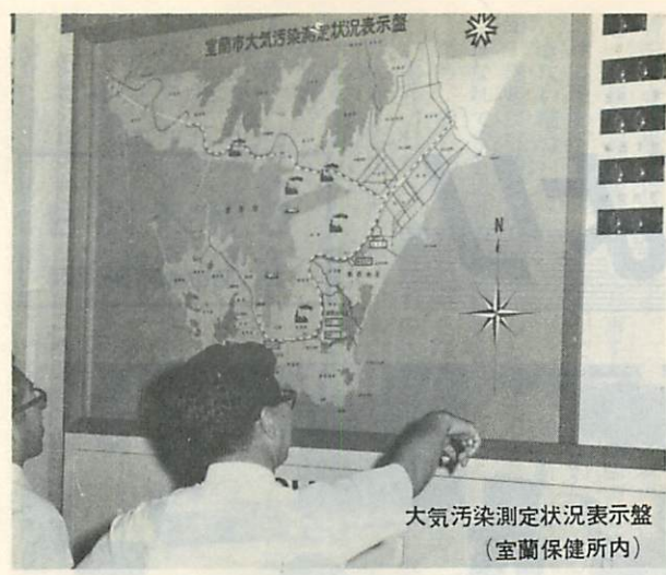
大気汚染測定状況表示盤 (室蘭保健所内)

一步を踏み出しました。その後この法律も「大気汚染防止法」（昭和四十三年）に生れかわり規制も強化されました。