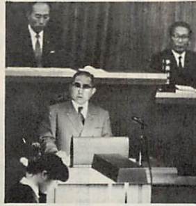
市政方針を説明する市長

児童の福祉を中心としながら、福祉対策を充実してまいりたいと存じます。 次に、公害防止対策につきましては、人間尊重の精神に徹し、市民の生命と健康を守ることに全力を傾注して、青空と緑の大自然を回復し、すみよいまちづくりを努力してまいりたいと存じます。 第三に、教育文化の向上につきましましては、次代をなう子弟の教育環境を充実し、教育水準の向上につとめるとともに、本市のもつ自然環境を活用しながら、香り高