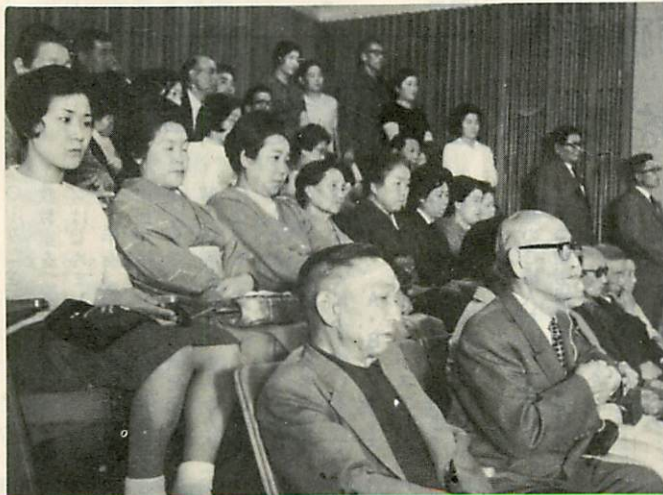
審議をみまもる市民