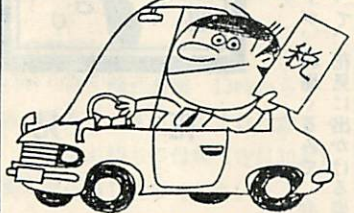
納期内に納めましょう