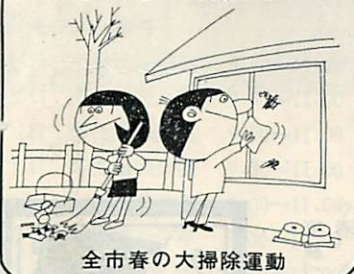
全市春の大掃除運動