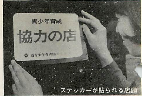
ステッカーが貼られる店頭

☆書店(十店) 文教堂、丸井今井室蘭支店(中央町) 石井書店、とよき薬局(母恋北町) 北海堂書店、坪内太陽堂、塩沢文省堂(輪西町) 文教堂支店(東町) しんや商事(中島町) 寺尾書店(本輪西町) ☆有機溶剤販売店(六十二店) 岩田商店、田辺商店(港南町) 佐藤食料品店(清水町) 小川北辰堂、津田商店(海岸町) 丸井今井室蘭支店、名取金物店(中央町) あつた薬局、市役所福利厚生会購売部(幸町) 森田商店