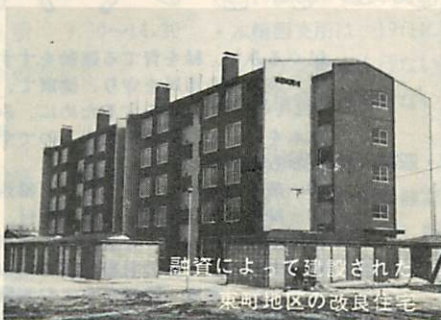
融資によって建設された 東明地区の改良住宅

住みよい町をつくる 郵便局の簡易保険 郵便局の簡易保険は、その積立金が、私たちの郷土を住みよくするための公共事業や施設づくりに大いに役立っております。 室蘭市も、昭和四十五年度には公営住宅建設事業に二億二千八百九十万円をはじめ、学校建設事業に七千六百万円、都市計画事業に二千二百六十万円、臨港道路整備事業に千二百八十万円、埠頭用地造成事業に六千万円、荷役機械新設事業に一億七千万円など、あわせて五億六千五百三十万円の融資を受けております。