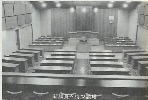
新議員を待つ議場