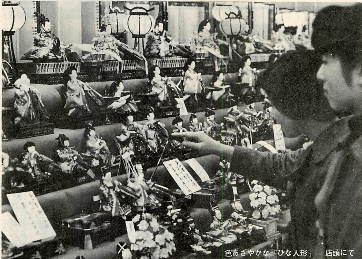
色あざやかな「ひな人形」= 店頭にて