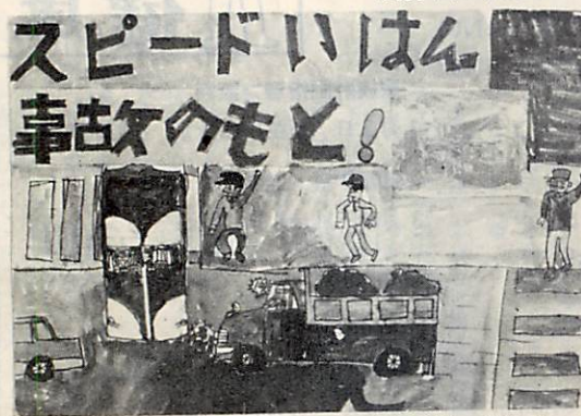
武播小3年 安達 幸