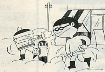
消火栓や道路の除雪はみんなの協力で