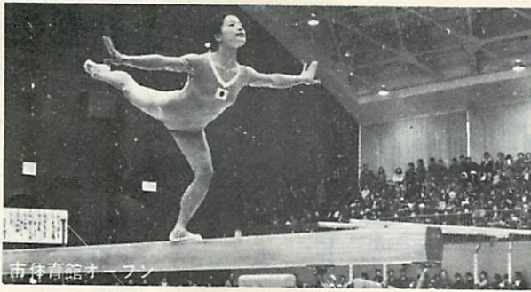
市体育館オープン