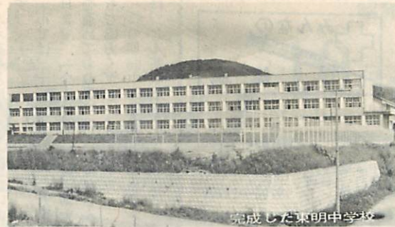
完成した東明中学校