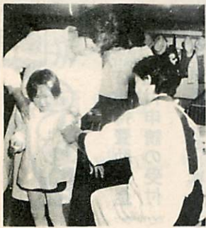
※インフルエンザワクチンは、一週間間隔で二回接種します。

●日程（毎週13時〜15時） 火曜日：輪西市民会館 水曜日：市役所中島支所 木曜日：市役所衛生課 金曜日：市役所衛生課 市役所本輪西支所