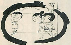
女性の一人歩き、ハデな服装は事故のもと 甘いことばにも気をつけよう

日常生活で誰れが聞いても大 きすぎる音、不快な音、思考や 睡眠の妨げになる音は明らかに 騒音です。 この騒音は、多種多様ですが 大別すると①交通騒音 ②工場 騒音 ③建設騒音 ④一般騒音 に分けられます。 騒音の程度を表わすには、音 の強さの単位「ホン」が使われ ます。たとえば「木の葉のふれ 合う音」は約二〇ホン、「普通 の会話」六〇ホン、「バスの中 」八〇ホン、「ジェット機の爆 音」二二〇ホンといったぐあい