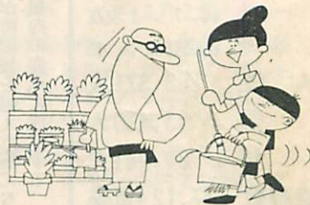
年金は明るい老後の道しるべ