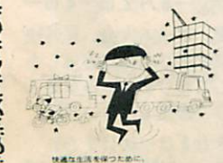
騒音はわたしたちの敵 健康な生活を営むために ひとりの注意がたいです

七〇ホン程度以上の騒音を絶 えず受けると疲労がはげしく、 仕事の能率が上がらなくなり、 イライラ、頭痛、消化不良、あ るいは血圧が高くなったりする ことがあります。