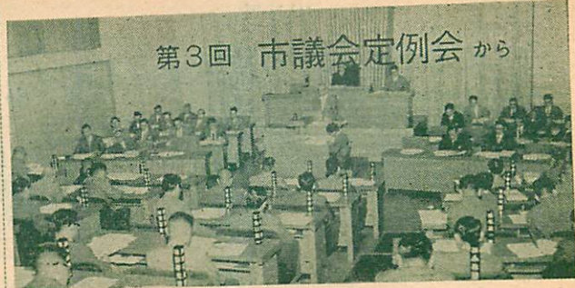
第3回市議会定例会から

この議会では、38年度の一般会計予算の追加などをはじめ、市民の消費生活の安定をはかるための「消費生活物資対策審議会」設置などの議案32件、昭和37年度の水道事業会計決算の認定案などが審議されましたが、このうち「水産物卸売市場条例」が継続審議になったほかはいずれも原案どおり決定しました。