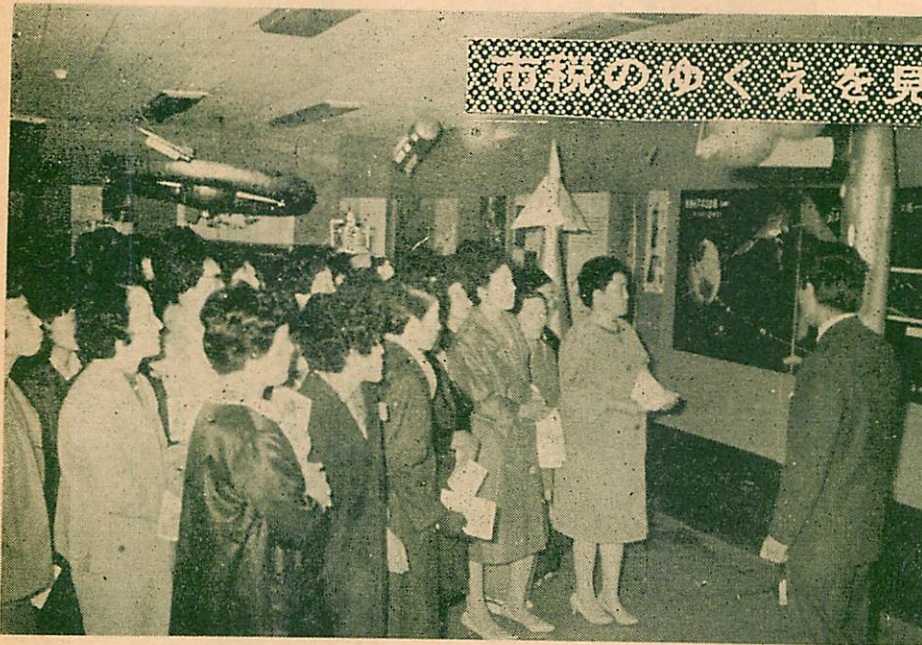
市税のゆくえを見る