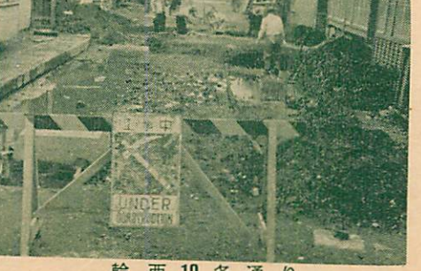
輪西 10 条通り