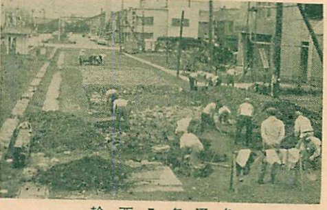
輪西 7 条通り