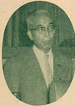
高薄市長が述べる市政方針

私は、市政執行に当つて、①情熱 ②責任感 ③愛情を基本的信条として、市民に直結した血のかよつた市政の執行を約束申し上げます。