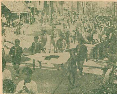
市民安全のパレード