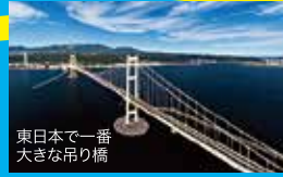
東日本で一番 大きな吊り橋