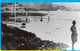
1872年 室蘭港のはじまり