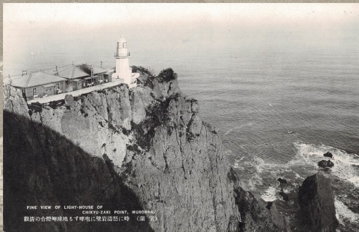
FINE VIEW OF LIGHT-HOUSE OF CHIKYU-ZAKI POINT, MURORAN. 観霧の台燈岬球地もす味地に壁岩誇怒に時 (蘭 室)