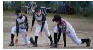
少年団と部活動の連携・交流

また、小学校と中学校の教職員の人事交流を推進し、小中双方の理解の促進と課題の解決を図っていきます。