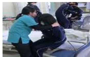
地域の人たちと共に生きる(福祉教育)

高齢福祉の専門家による講話や体験学習を通して、ご高齢の方たちと共に生きる意識と態度を養います。