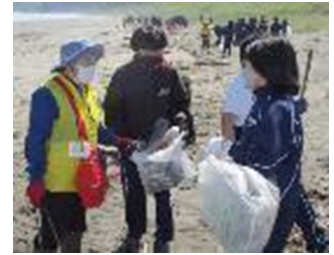
地域の方々との交流、協働