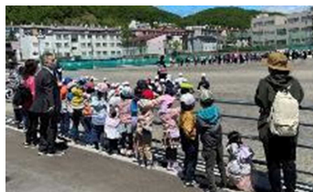
幼保小連携の取組・交流

幼児に伝わる言葉遣いや関わり方を工夫する中で、小学生は、思いやりの心を育て、自分の成長に気付きます。