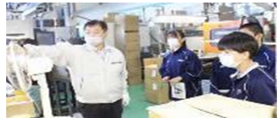
ふるさと学習(市内自主研修)

子どもたちが、企業や地域の方とふれ合いながらのさまざまな学習を通して、「室蘭ってすごいなあ」「室蘭がますます好きになった」「室蘭の人ってやさしいなあ」「大人って室蘭