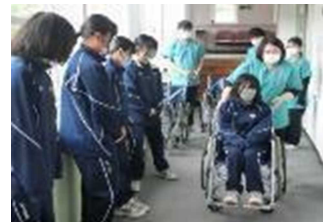
ふるさと室蘭で共に生きる(福祉教育)