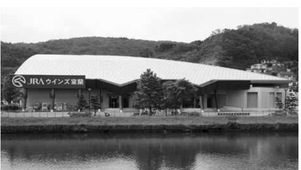
5月26日で営業を終了したウインズ室蘭

【答】あらゆる可能性について検討したが、解体更地化という所有者の意向が示された。今後地域との情報共有に努めていきたい。