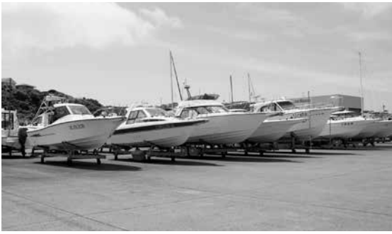
エンルムマリナーの陸置き施設

【答】施設貸し出しによる収益事業を行うことは可能であり、指定管理者にも収益事業を行うことを促していく。