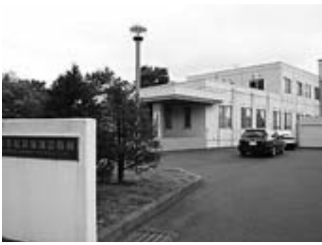
存続が望まれる船員保険診療所

【答】社保庁に対し医療・健診体制維持のため民間譲渡や船員保険の福祉施設としての存続を求めてきた。今後も市民の健康を守るため、存続に