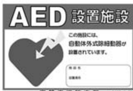
AED設置施設に掲示されている標示板

ートナー施設」として「AED設置施設」と記された標示板を掲示。市のホームページに一覧表をマップ化した「AEDマップ」を掲載し、市民周知している。