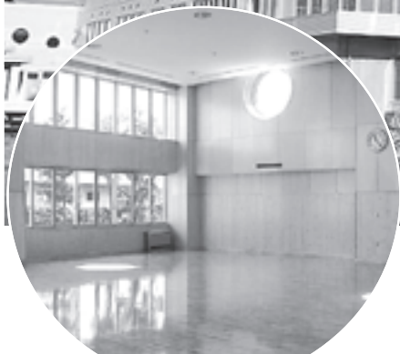
窓が特徴的な多目的ホール

中島小学校と日新小学校の統合により、平成22年4月に開校する予定の旭ヶ丘小学校。現在の中島小学校敷地での建設工事が、終盤を迎えようとしています。体育館は既に完成し、写真の校舎については、10月末完成予定です。この新しい校舎で、新たな仲間が集い、子供たちの元気な姿がたくさん見られるのを楽しみにしています。