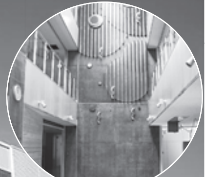
明るく楽しいエントランス