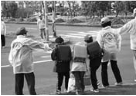
寿町町会の子供を守る取り組み