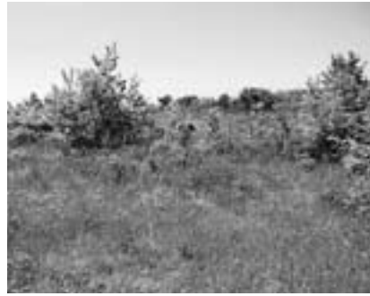
植栽事業が進む新富町旧ごみ処分場

【答】試験植栽で活着（※4）を確認しており、市民協働の観点から今後も地域の方々と一緒に進めていく。