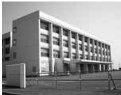
八丁平地区のまちづくりも含めた有効活用が求められている室蘭商業高校

【答】向陽中学校として一時的に活用する場合、学校給食設備設置など新たな施設整備が必要。活用策は保護者及び地域住民の意見を伺いながら、20年度中に考え方をまとめたい。また、仮に中学校として活用する方針が定まった場合、道の財産である公共施設であることや、一時的な施設利用であることから、無償貸与を道教委に対してお願いすることになるものと考ええる。