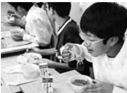
市内30校の約7,500食を給食センターが賄っている

【答】現在も効果を上げているが、各部署との連携を強化するとともに、新たに就労支援員を配置し、さらに充実を図りたい。特に、不正受給額が多額で悪質な場合は罰則規定の厳格適用により保護行政の適正な執行に努めていく。