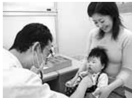
地域医療体制の確保は市民の安心・安全な暮らしの基盤