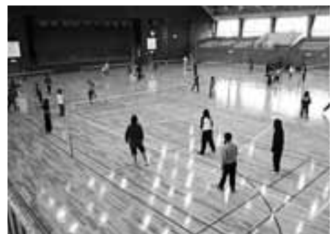
3月にリニューアル完了した体育館

【答】市が開催した極東ロシアビジネス懇話会では、環境関連企業がロシア、極東にビジネスチャンスを見出そうとしており、サミット関連の環境総合展では、本市企業が海外へ情報発信を計画している。