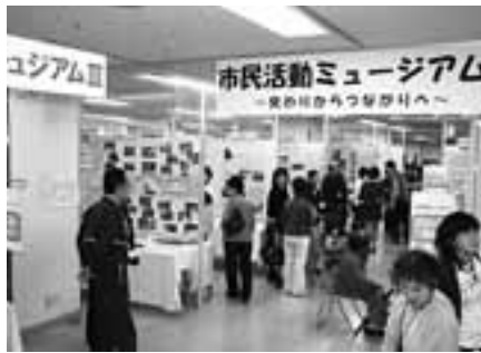
市民協働推進の観点から職員力の向上が求められる

【答】前年度より4.9%増加の95.5%となる見込みで、内訳の主なものは人件費28%、公債費16.9%、扶助費11.7%となっており、今後も上昇傾向が続くものと推計している。