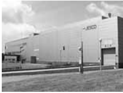
今年度から本格的な操業が始まるPCB廃棄物処理施設

【答】運転会社11名のうち、20代、30代各10名、出向者が20数名である。事業終了後の施設活用は、時期を見定め、国に要請したい。