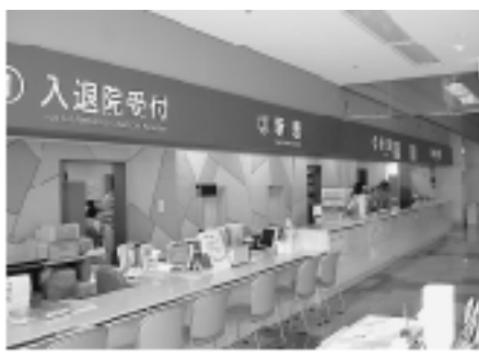
経営健全化計画に取り 組む市立室蘭総合病院

【答】ビジョンとして、より一層患者さん本位の病院経営に取り組み、臨床研修病院としての役割を果たすとともに、急性期病院を指す。また、経営健全化方策を盛り込んだ3～5年程度の中長期計画の策定について検討する。