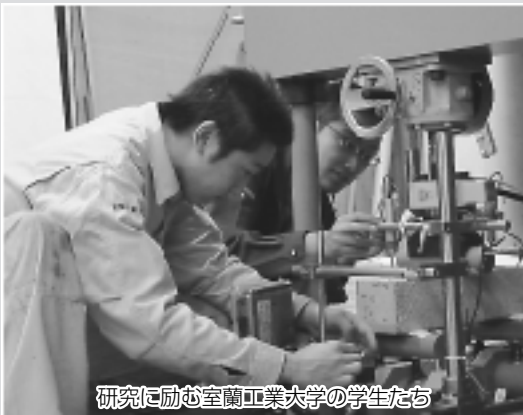
研究に励む室蘭工業大学の学生たち