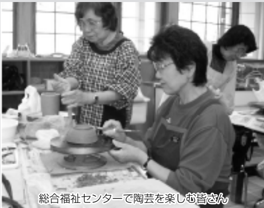
総合福祉センターで陶芸を楽しむ皆さん