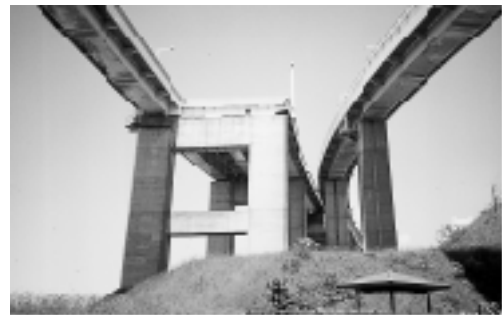
地上3.2メートルで途切れた 白鳥新道2期区間との接続部分

【問】白鳥大橋の開通以来、市民は本区間の整備を待ち望んでいる。現在、室蘭開発建設部と勉強会を開催する中、課題を整理しているが、①整備手法を含め、結論を出す時期の考え方。②市民は、「暫定無料」の継続を強く望んでいる。「国道の並行区間解消」問題と併せ市長の見解を伺う。