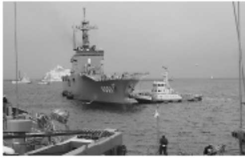
平成16年2月にイラクへの物資輸送のため室蘭港入りした「おおすみ」

【答】 補給、休養時は港湾施設の能力に照らし、適切か判断し許可している。訓練での利用は荷役船を優先に使用許可している。また、港や町の活性化に役立っていると認識しているので、これまでも自衛艦の寄港をお願いしている。