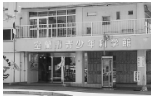
平成17年11月から指定管理者による運営がスタートする青少年科学館

での多数決方式による公平性の確保ができ、総合的に透明性、公平性は担保できると考えている。