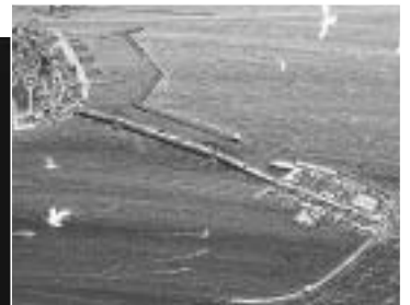
⑤ Mランド完成イメージ図