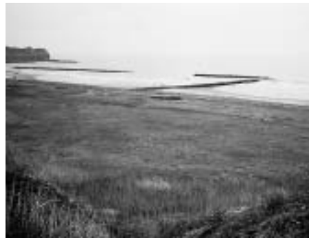
潮見公園内のピオトープ候補地

【問】協働のまちづくりのモデル事業として推進する考えは。 【答】地域の団体が主体となって推進する中で、市も支援する。