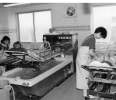
施設サービスで受ける入浴