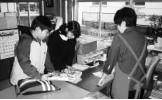
図書館を利用する子供たち

【問】利用者の自立・支援につなげていくには、ケアマネジャーの果たす役割が重要であり、その資質向上を促進させる方策について。 【答】室蘭ケアマネジャー連絡会や、介護保険サービス事業所連絡会を通じ情報提供をし、さらに電話や来所による相談に応じている。