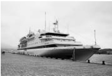
中央埠頭に入港した 客船クリッパーオデッセイ号

【答】職員団体の理解も得ながら、お話を十分に受け止め予算編成までには、市民の理解をいたかける制度、運用に改めたい。