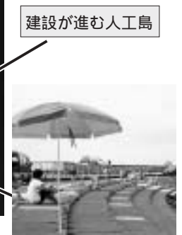
建設が進む人工島