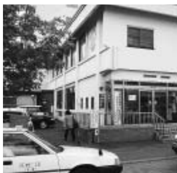
狭い中島サービスセンター駐車場

【答】市と道は改善指導を行った。環境基本条例制定に当たっては市民会議や審議会を設置する。