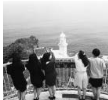
本市が誇る観光地、地球岬

【問】レストハウスや休憩所・トイレ等の整備を促進すべきでは。 【答】地球岬に休憩施設を検討中、測量山は既存施設を整備したい。