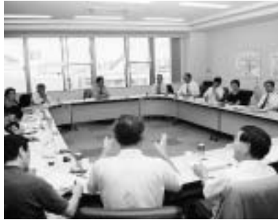
活発な論議を進める 行政改革推進委員会

【答】前者は道と十分連携を図りながら対応したい。後者は、介護保険制度の事業者や、新規事業者の参入を働きかけ、またデイサービスやショートステイは、介護保険制度上の事業所を利用する「相互利用制度」の活用も検討したい。