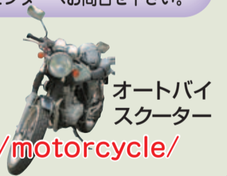
オートバイ スクーター