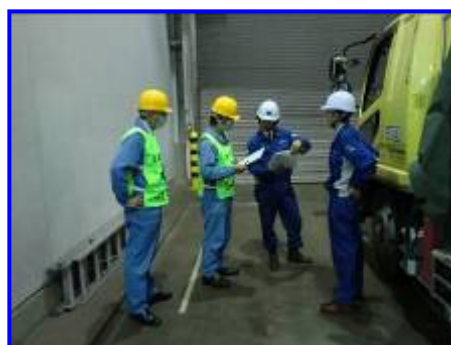
受入時検査の様子