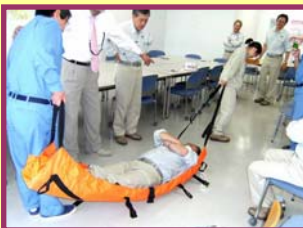
8月18日(水)エアストレッチャー訓練