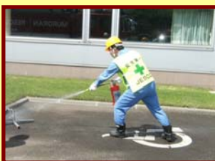
8月26日(木) PCB処理情報センター消防訓練

北海道事業所では施設の重大災害発生時の防災・保安技術の向上のため、いろいろな訓練を実施しています。