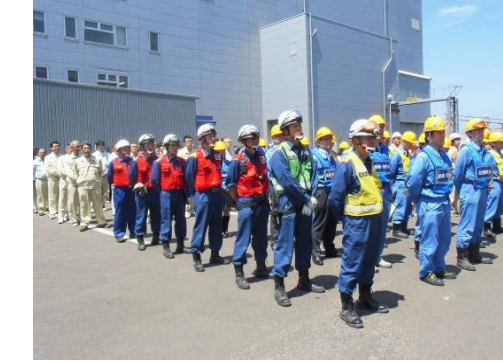
全職員、公設消防隊 整列