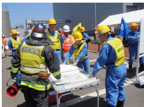
連絡・渉外班長:対策本部長へ第4報完了を報告