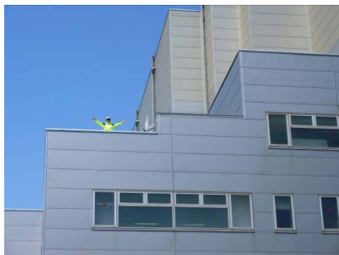
屋上要救助者:救助要請(作業員2名避難)