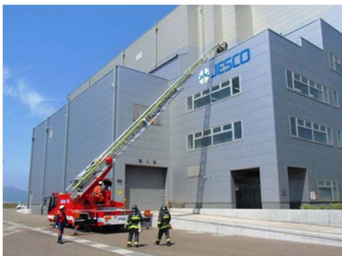
公設消防隊:梯子車での救出作業