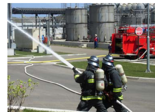
公設消防隊:2F会議室火災(2) 消火