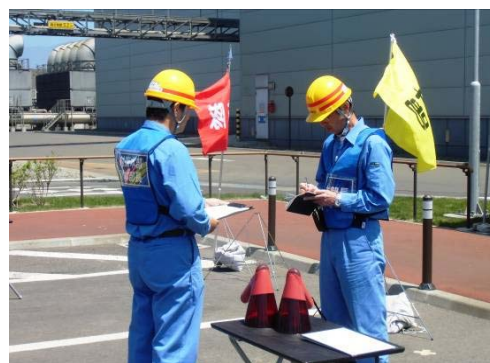
対策副本部長:対策本部長へ「津波警報」発令を報告