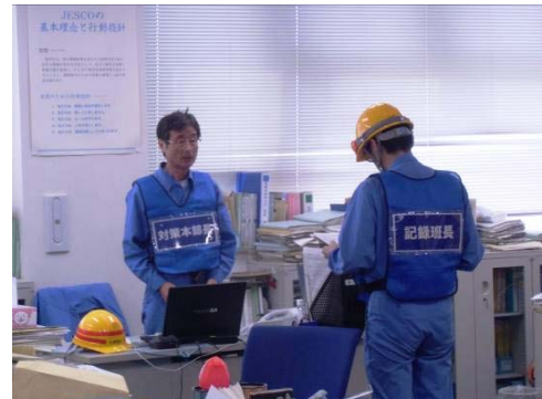
青木所長:全館放送(避難、自衛防災隊設置)を指示