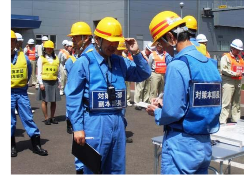
対策本部 設置完了