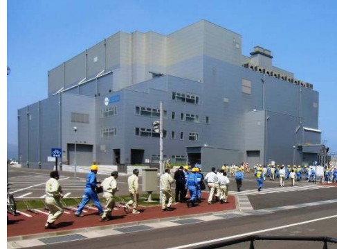
JESCO・MEPS(当初)職員 避難状況