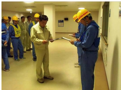
当初施設職員:避難・点呼完了(2Fホール)