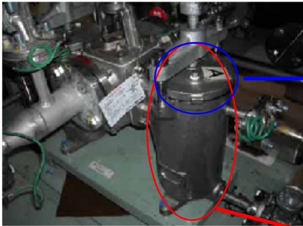
複式ストレーナA (ST-A) 全体