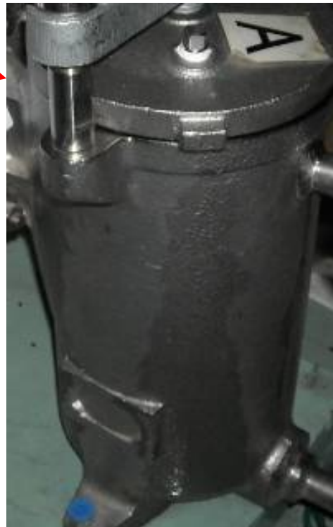
ST-A 蓋部からの漏洩状況