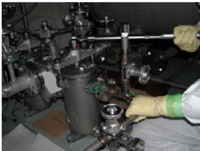
【対策】トルクレンチを使用したカバー押さえボルトの締め付け作業状況