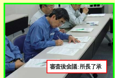
審査後会議: 所長了承