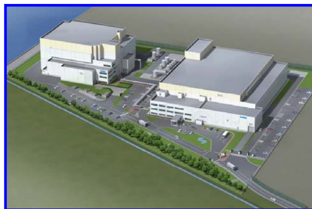
左側の建物が増設施設、右側が既存施設です