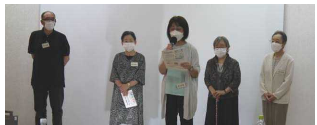
男女平等参画プラザ利用団体の紹介と実行委員長の挨拶

「結婚・家庭におけるジェンダー」をテーマにした巻では、近年では比較的多様なあり方が認められてきたとはいえ、性的役割に対する価値観が未だ根強く残っている中、若い世代の意見から考える内容でした。その中の20~30代の男女のトークセッションでは、「両親を見て将来的には結婚したいと思う」「今、自分がしたいこと優先。家族から（結婚を）勧められるプレッシャーを感じる」「事実婚、すごくいい」「独身について、自分の夢や仕事を優先、スタイルをつらぬくのはカッコいい」などの率直な意見が交わされ、結婚や家庭におけるジェンダーに関する様々な事柄について身近な事例をもとに考える機会となりました。