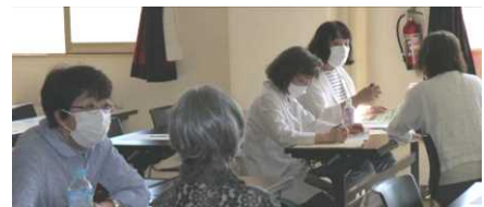
意見交換をする参加者