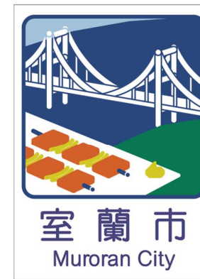
(カントリーサイン) ※3案の中から決定